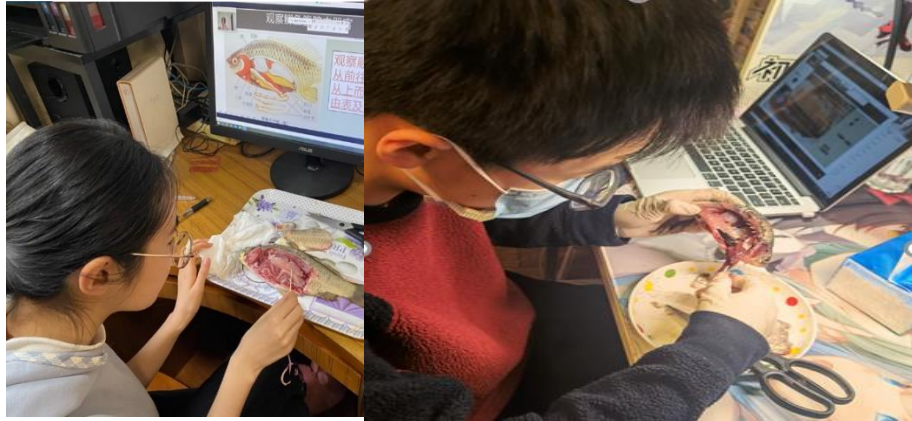
图 2：学生线上课上正在动手解剖实验