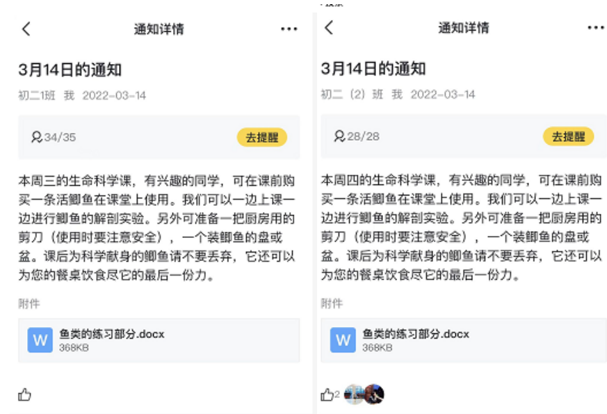
图 1 通知学生当天上课时可自备鲫鱼

2. 为了帮助学生能更好地完成课前准备工作，也为了能获得更多家长的支持，我们还特地以通知的形式（图 1），把提醒内容发送到晓黑板，让全体学生和家长都能接收到，以便提前准备。