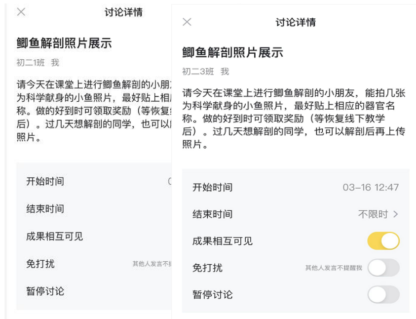
图 3：发布上传鲫鱼解剖作品的讨论作业

课后，我们在晓黑板发布了上传鲫鱼解剖作品的讨论作业（图 3），不限时，并且全员都可以看到相关讨论内容。参与解剖的同学积极上传解剖作品，未解剖的同学认真评价其他同学的作品。因小区封闭未买到鲫鱼的学生还可以在解封后再补上作品。