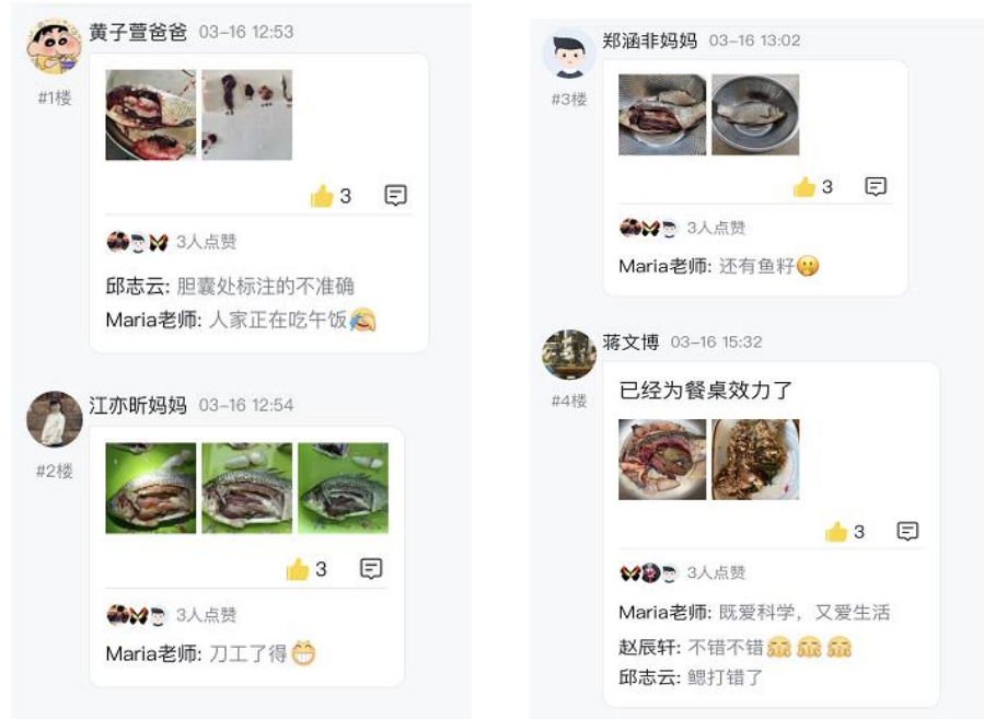
图 5: 部分学生作品 (右下图还有餐桌文化)